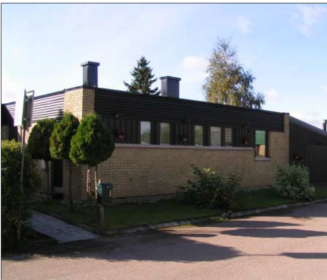
Husen har inga eller låga socklar. Gavelspetsen är ofta klädd med trä-panel. Enluftsönster eller fönster i förband.