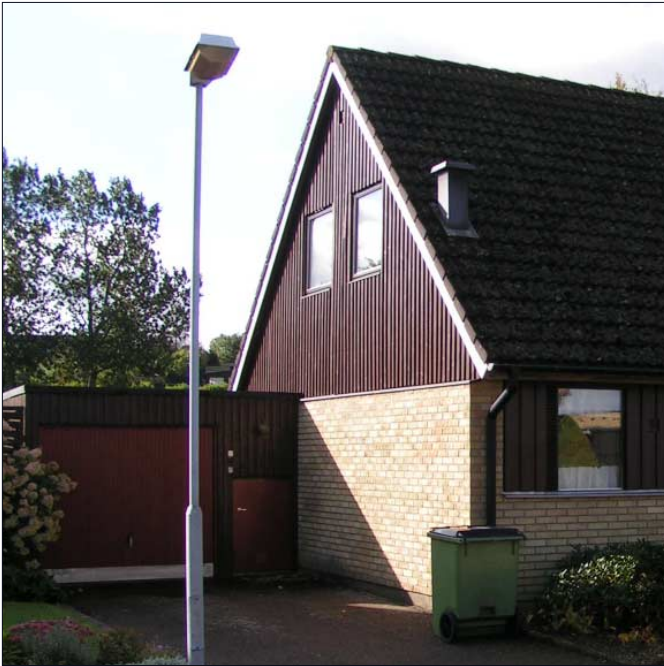
Garaget och bostadshuset är ofta sammanbyggda.