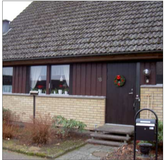
Dörrar med sidoljus.