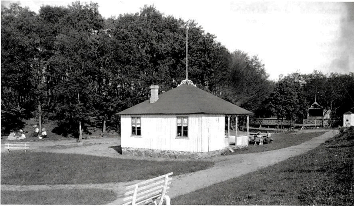
Hörby tivoli i Thorshills hage år 1906. Den trädbeklädda kullen i fonden är idag minneslund.