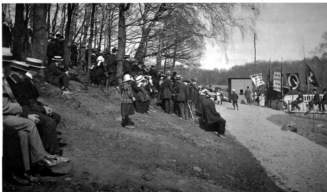
1:a maj-möte i Karnas backe, omkring 1920.

samlades man till både fackliga möten, vår- och sommarfester, dans med levande musik och artister med ibland halsbrytande underhållning. Tidsandan efterfrågade gärna spektakulära upplevelser.