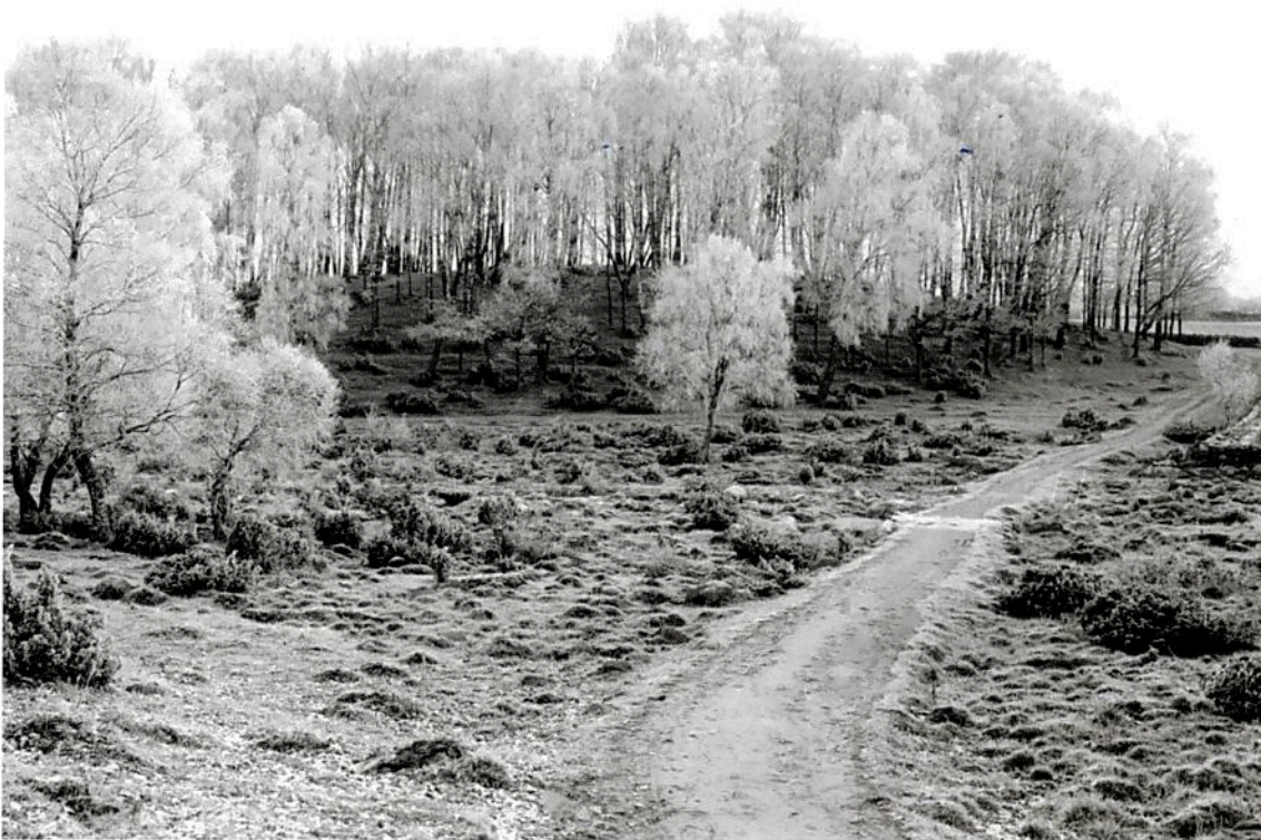
Vinterdag i Karnas backe år 1912. Fotot taget innan tivolit etablerades, när området fortfarande var en kuperad utmark.