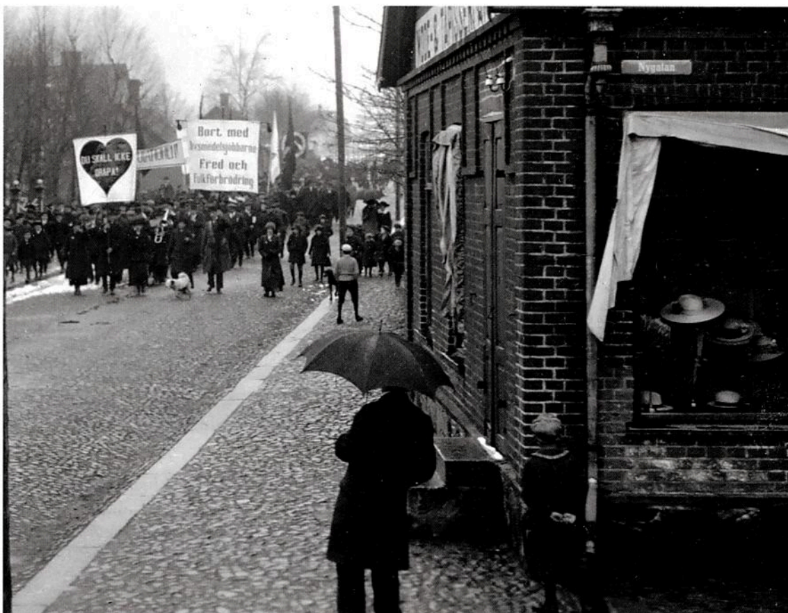
Demonstrationståget utgick från Hörby centrum, för vidare marsch ut till stormötet i Karnas backe.