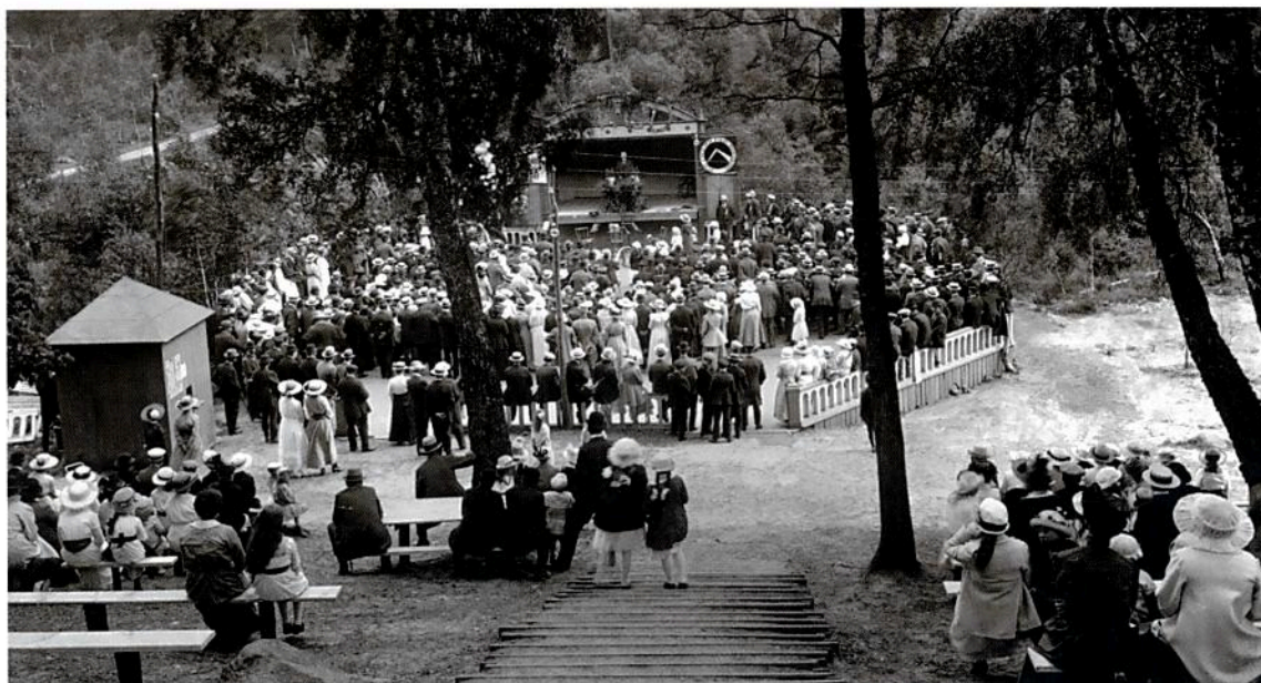
Föredrag i Karnas backe, en sommardag 1915-20.

identifierats som ursprungligen från Baltiska utställningen.