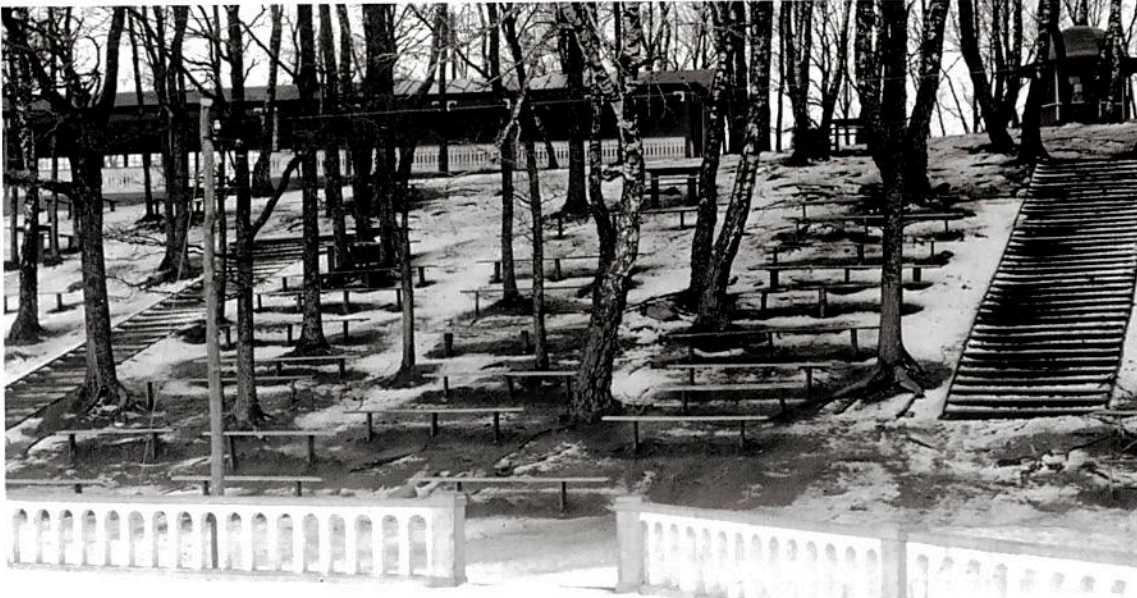
Serveringsbyggnaden på kullens krön, sedd från dansbanan. Till höger den kupolförsedda lilla tombolabyggnaden som förmodligen inköptes från Baltiska utställningen.

ingen vågar nog fuska mitt framför orkestern - dansintäkterna är ju del av musikernas gage.