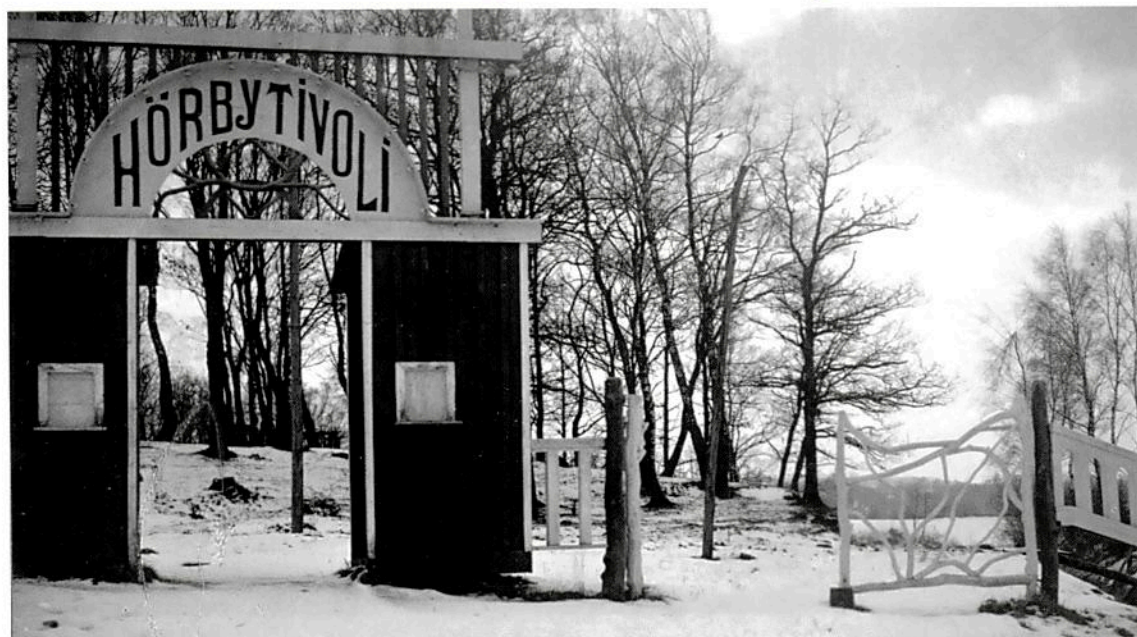
Entrén till Hörby tivoli i Karnas backe, omkring 1920.

Man kan även tänka sig att Leijon passade på att göra några inköp vid auktionen i Thorshill. En mindre kupolförsedd byggnad med tombola, placerad på krönet i Karnas backe, har i alla fall