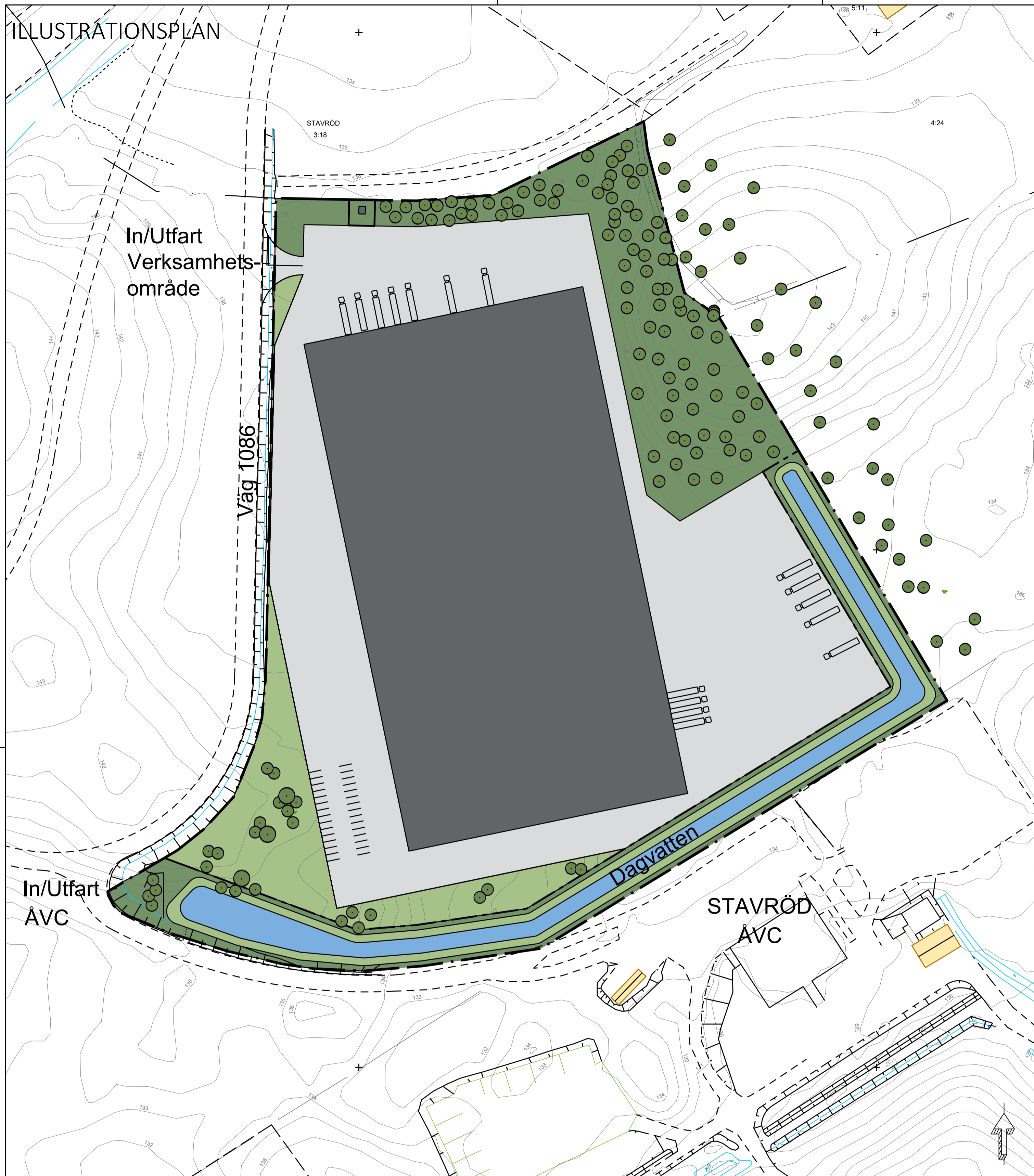
Alternativ 1, möjlig utformning av området där byggnationen samlas inom en fastighet