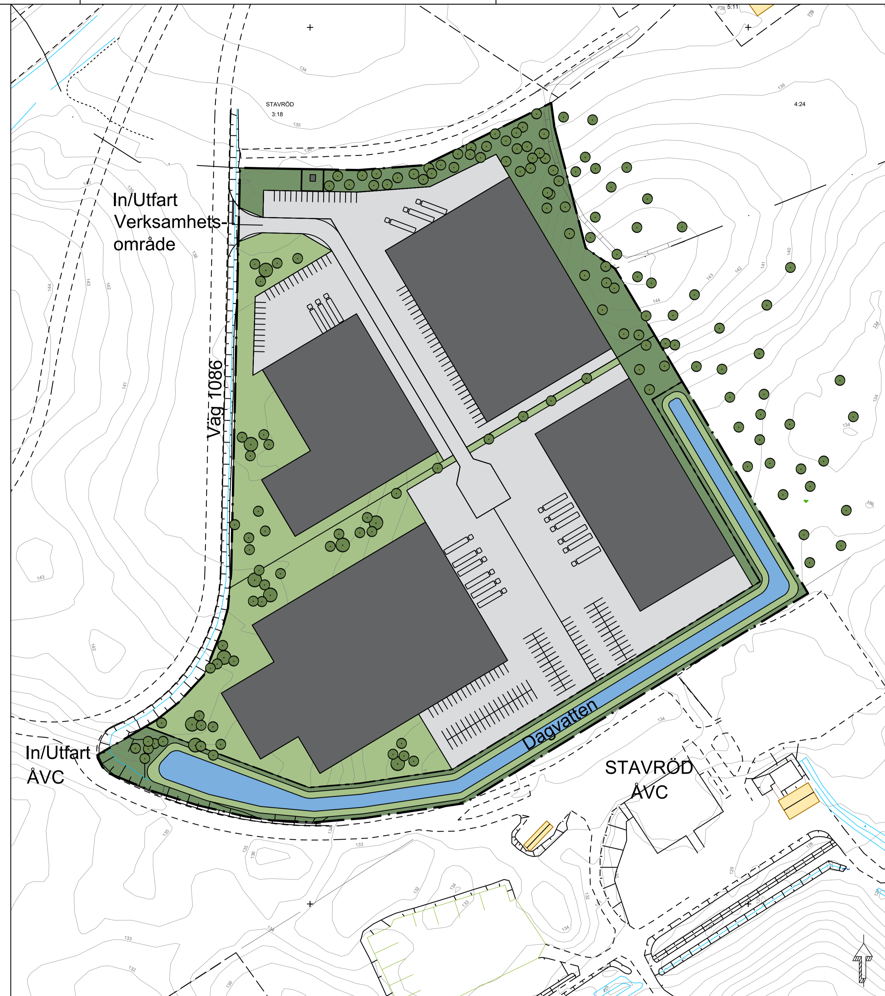
Alternativ 2, möjlig utformning av området där byggnation fördelats på fyra fastigheter