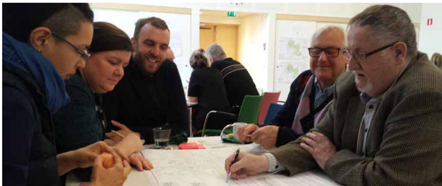
Workshop med politiker och tjänstemän från kommunen.