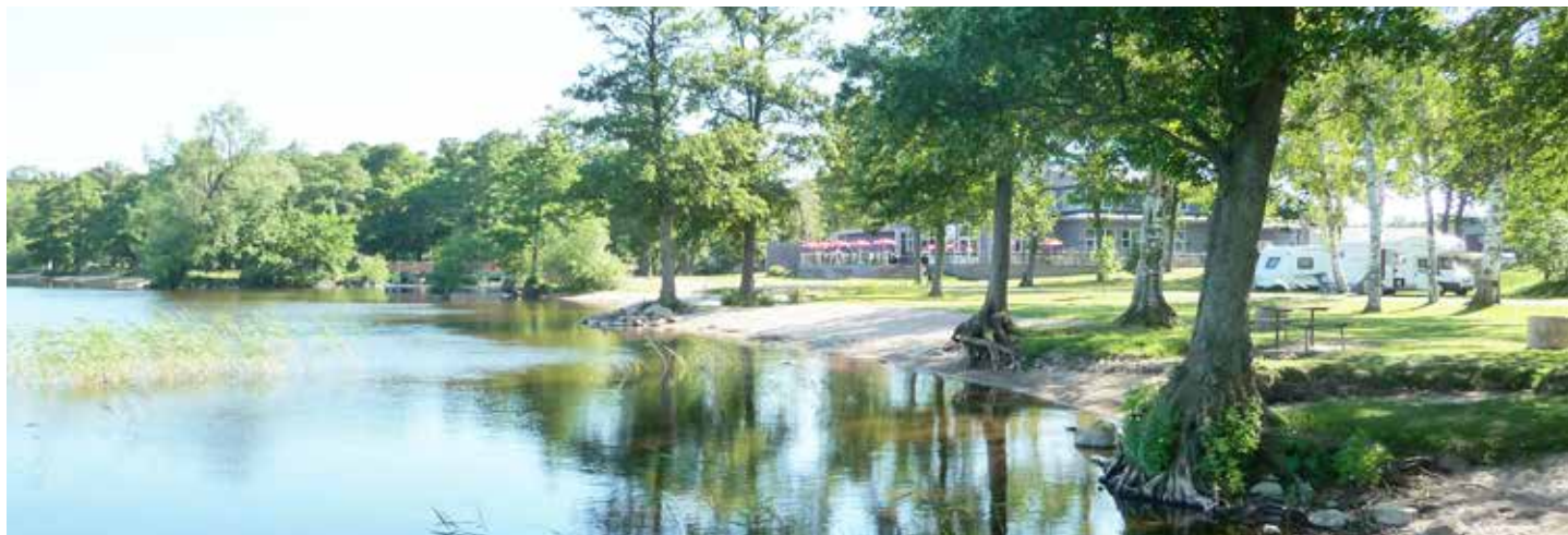
Ringsjöstrand camping och den kommunala badplatsen.