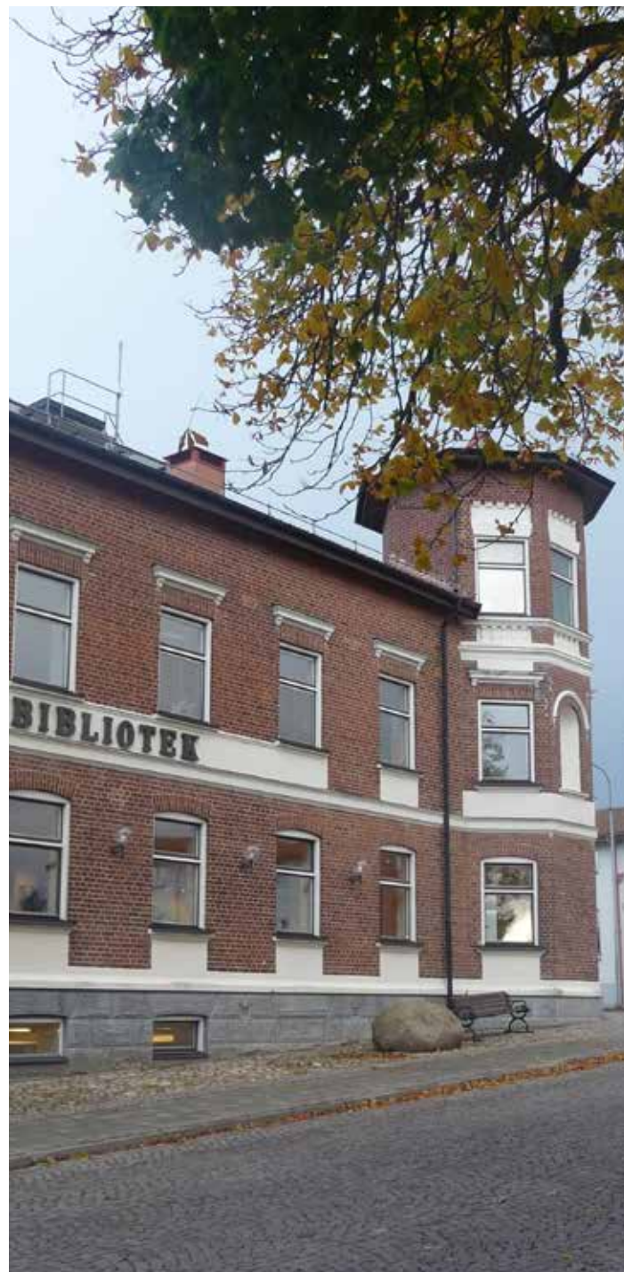
Bibliotek, Hörby tätort.

I Hörby kommun finns ett par museum runt om i kommunen. Inne i Hörby tätort, mitt emot biblioteket ligger Hörby museum. Museet innefattar en stor del av bygdens minnen med över åtta tusen föremål och tre tusen bilder. Museibyggnaden uppfördes 1885 som Frosta Härads tingsrätt men när tingsrätten flyttade till Eslöv 1970 blev huset i stället