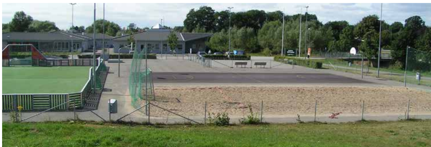
Spontanidrottsarenan, Hörby tätort.