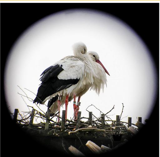
FÅGELSKÅDNINGENS DAG 3/5