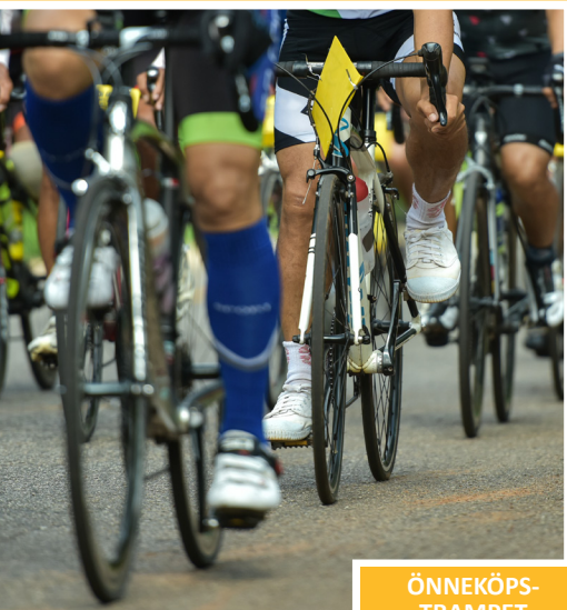
ÖNNEKÖPS- TRAMPET 23/5