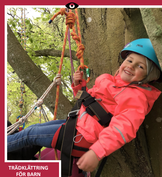
TRÄDKLÄTTRING FÖR BARN 13/6