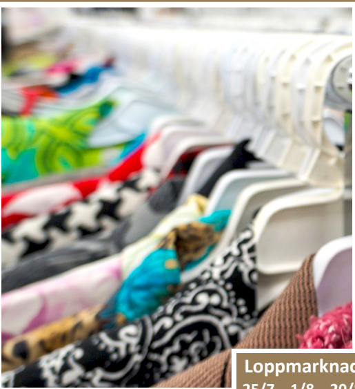
Loppmarknad 25/7 – 1/8 – 20/8