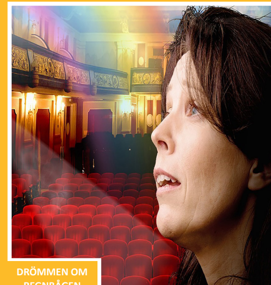
DRÖMMEN OM REGNBÅGEN 14/5