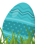
Illustration: Gunilla Bergström

Text: Kalas, Alfons Åberg av Gunilla Bergström