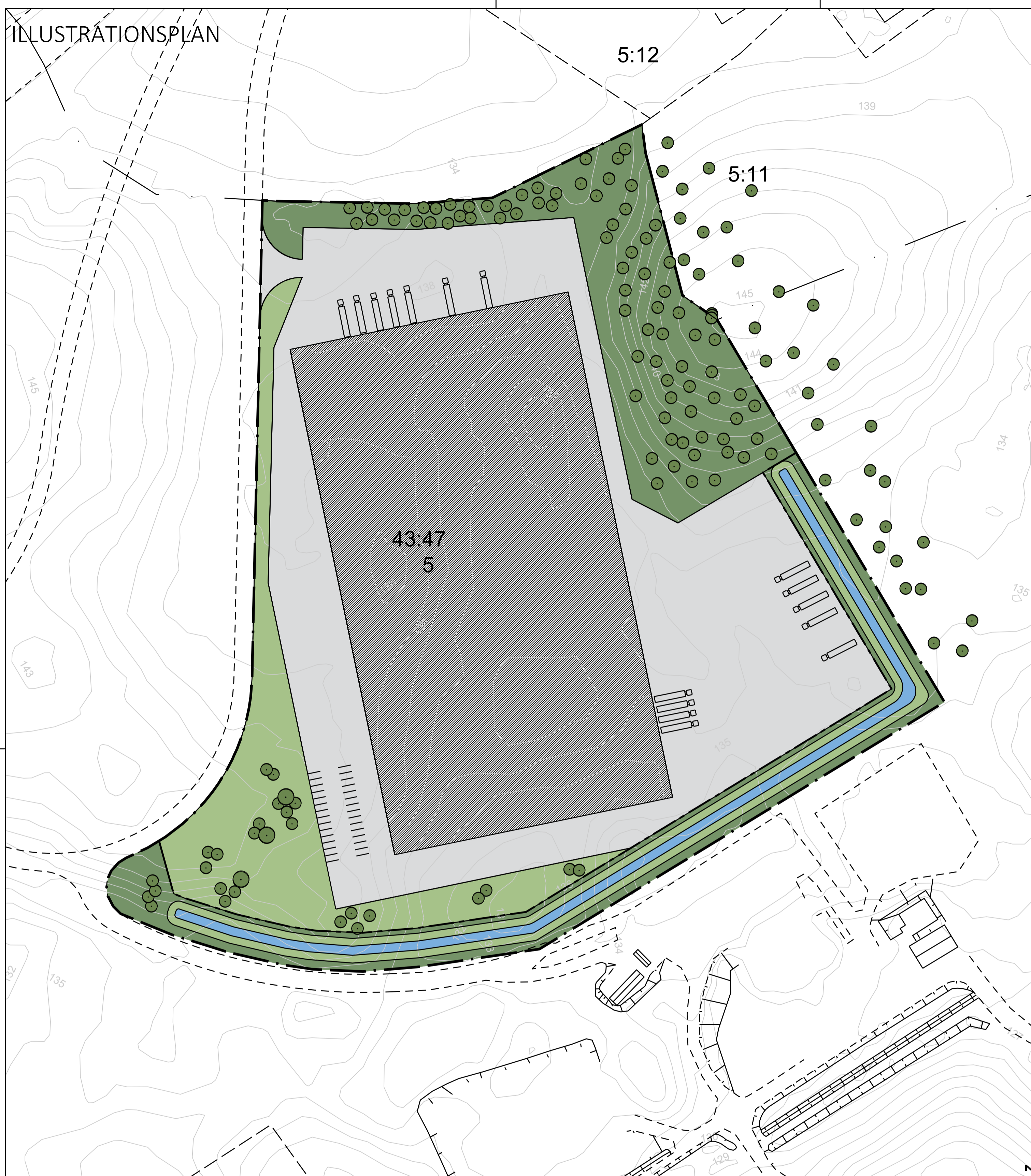
Alternativ 1, möjlig utformning av området där byggnationen samlas inom en fastighet