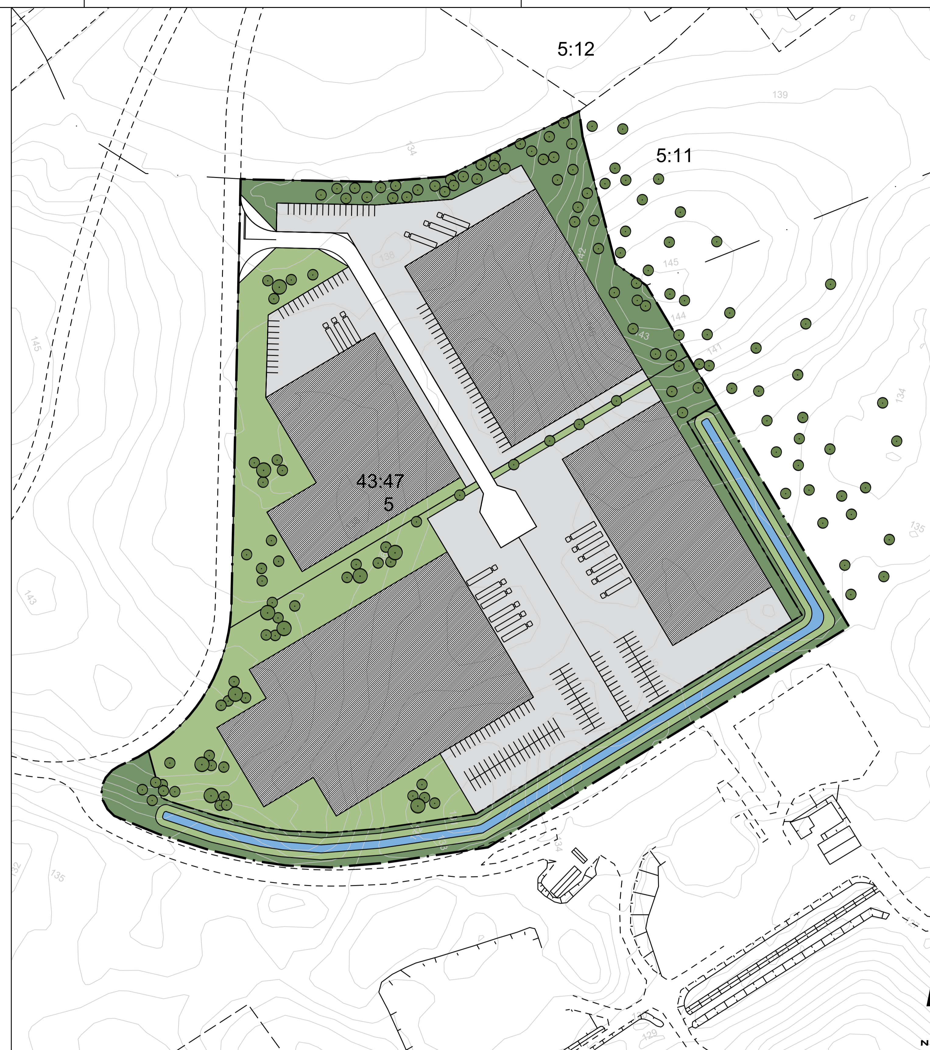
Alternativ 2, möjlig utformning av området där byggnation fördelats på fyra fastigheter